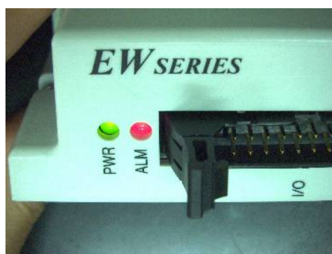
斜め方向から見た時