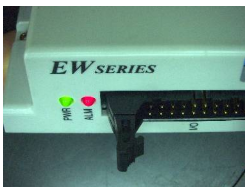
斜め方向から見た時