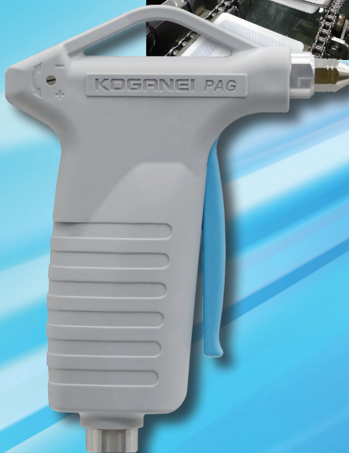
パルスブローエアーガン PAG シリーズ